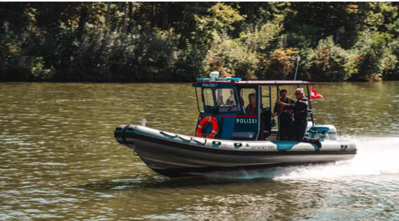
Polizeiboot als Einsatzfahrzeug nun auch in der Steiermark unterwegs.

Mit Motorbrummen, Wellen und Applaus sticht es in See: Panthera, das Einsatzboot der steirischen Wasserpolizei. Damit bringt es Polizeiarbeit & Co direkt auf die Flüsse und Seen in der Steiermark.