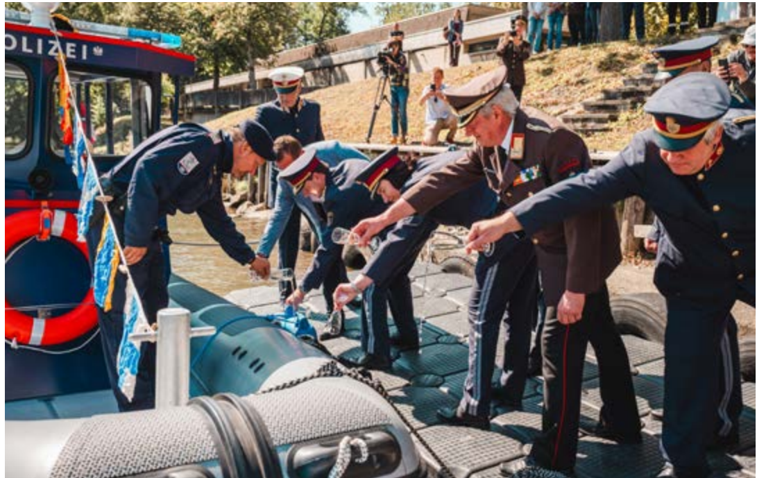
Das Polizeiboot wurde feierlich auf den Namen „Panthera“ getauft.

Die Aufgaben der Wasserpolizei, kurz WP, sind vielfältig und gehen weit über reine Streifenfahrten hinaus. Im Fokus stehen die Durchsetzung des Schifffahrtsrechts, die Kontrolle von Geschwindigkeiten und Beeinträchtigungen sowie die Überprüfung der Verkehrssicherheit von Booten. Darüber hinaus leisten die speziell geschulten Beamtinnen und Beamten Rettungsmaßnahmen, verfolgen Straftaten, wahren das Fremden- und Grenzkontrollrecht und engagieren sich im Wasser- und Umweltschutz. Damit bildet die Wasserpolizei einen wichtigen Pfeiler für Sicherheit und Ordnung im und am Wasser.