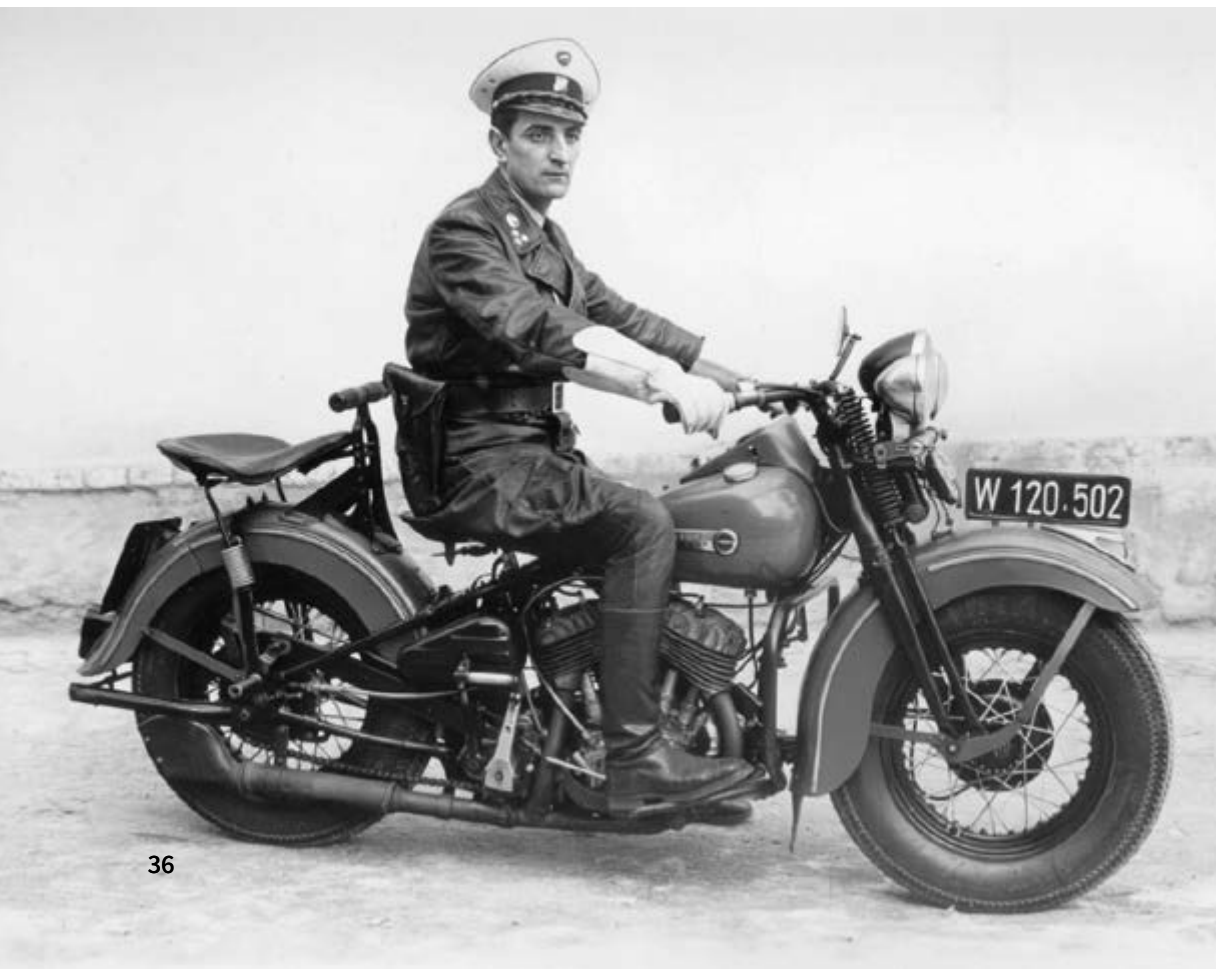
Aus dem Jahr 1956: eine Harley Davidson der Bundespolizei- direktion

Neben der vollständigen Umstellung auf Digitalfunk (BOS) innerhalb der steirischen Polizei ging das Jahr 2015 als Beginn der so genannten „Flüchtlingskrise“ in die steirische und europäische Geschichte ein. Mehrere Tausend Menschen kamen