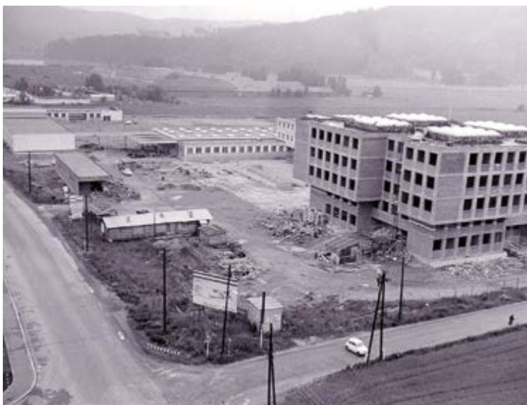
Das Gebäude der Landespolizeidirektion aus dem Jahr 1973

Die Aufgaben sind vielfältiger geworden, die rechtlichen Rahmenbedingungen komplexer, die Anforderungen höher. Aber eines bleibt konstant: Der Einsatzwille und die Loyalität der Kolleginnen und Kollegen in der Steiermark.