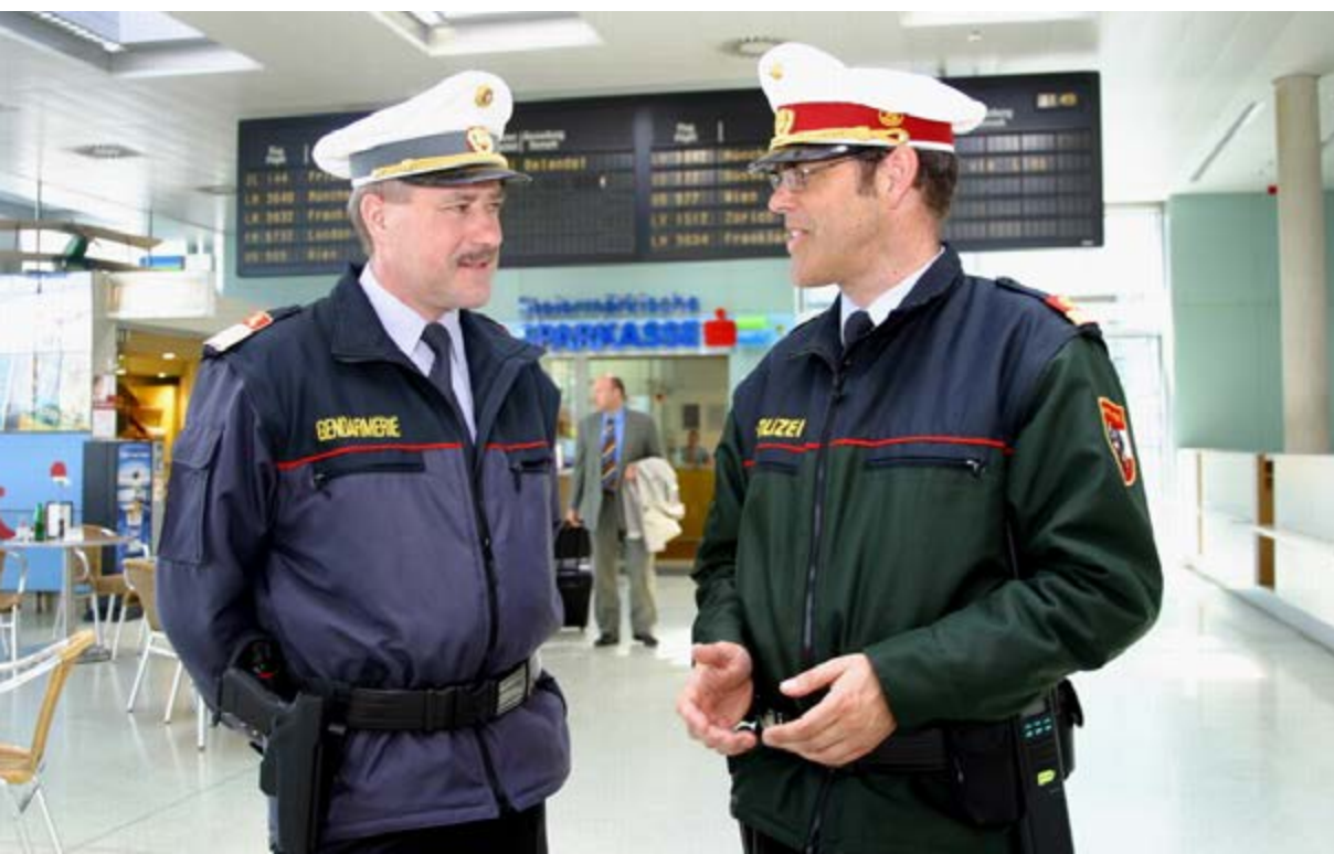
Kollegen in der Gendarmerie- und Polizeiuniform im Jahr 2006

Ob auf 2.000 Metern Höhe in den Tauern oder im dichten Stadtverkehr von Graz – die steirische Bundespolizei war und ist überall dort, wo sie gebraucht wird.