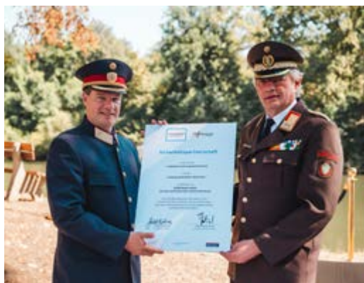
Sicherheitspartnerschaft zwischen Polizei und Feuerwehr.

Organisatorisch gehört die Wasserpolizei zur Landesverkehrsabteilung. Das bedeutet, dass die Beamtinnen und Beamten ihren regulären Dienst versehen und im Anlassfall oder unter vorab geplanten Diensten in den Wasserpolizeidienst (WPD) wechseln. Egal ob bei vorab avisiertem Bedarf oder im Anlassfall: Die Wasserpolizei steht von Routinekontrollen über Rettungsaktionen bis hin zu Gefahrensituationen im Einsatz.